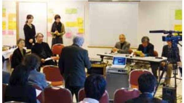
図1—まちづくり展連続ワークショップの様子

会は後方支援するというかたちとした。継続的に情報交換するほか、復興調査に関しては、初めての試みとして被災地の復興まちづくり支援を兼ねた復興調査を企画することとなった。具体的には、復興関連情報、および、被災地の復興まちづくりの状況を提供する「復興まちづくり情報ポータルサイト ( http://jsurp.net/wp/ )」を都市計画家協会と協働して構築し、そこに掲載される情報の収集、整理を通して復興調査を進めるというものである。復興調査と復興まちづくり支援の両立に加え、被災地への研究者による復興調査公害を防ぐことも意図したものである。しかしながら原稿執筆時点では、まだ最低限の情報が掲載されているに留まっており、当初の目的を達成しているとは言えない状況である。早急に改善、発展させる必要がある。