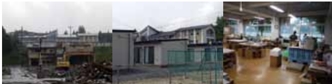
写真25 南三陸町歌津の市街地から高台の伊里前小学校を見る。手前の破壊された建物は公民館

室が物資置場、調理室、ボランティア室といった避難所関連の機能に充てられている。中学校の部活動の一部は、伊里前小の多目的ホールや体育館で行っている。小中学校が地域でほぼ唯一残った公共施設であるため、多目的室は集会や説明会など、地域の集まりに使われる。