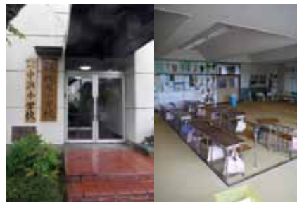
写真21 2校「併設」を示す玄関【山元町 中浜小・坂元小(坂元小学校舎)】 写真22 音楽室を教室として使用。特別教室のなかでは音楽室と図工室がはじめに教室に転用される傾向があった【山元町 山下二小(山下小学校舎)】