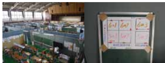
写真23 体育館内部。イベント用のパーティションは板段ボールのように自立させるためにジグザグに置く必要がなく、教室・通路の有効スペースが大きくなった【仙台市 西多賀小】 写真24 センチ単位で体育館の寸法を測し、プランを作成したという。ステージは英語活動や少人数指導に使われている【仙台市 西多賀小】

9月からはプレハブ校舎の建設工事に合わせて、近隣の小学校にいったん移り、11月の完成時に戻ることになった。移転先が昨年度分校した学校で児童同士はなじみがあり、期間限定であることからストレスは少ないのではないかと学校は考えている。