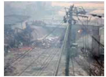
写真4 石巻市立病院に押し寄せる津波