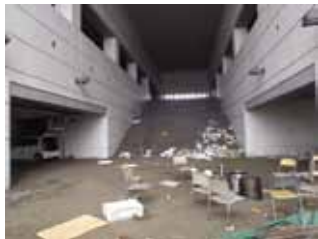
写真31 石巻文化センター