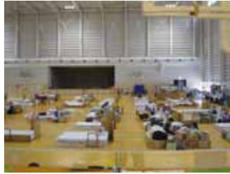
写真7 病院スタッフが常駐する福祉避難所