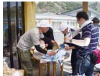
写真17 日々さまざまな工夫をしながら危機を乗り越える施設職員

地震直後、近隣の指定避難所(小学校)へ避難開始。校庭は車と人で混乱。建物に入れない多数の避難者。自力で移動できる人は学校建物の上階に移動。結果的に校庭で待機していた多数(利用者7名含む)が津波の犠牲に。建物内に避難した人は、翌日自衛隊ヘリで救助。その後、同じ事業者が運営する他のグループホームに移動。18名のグループホームに避難者11名が加わり避難生活開始。個室を2人部屋として対応。ガスはプロパンガスのため利用可、電気は1週間後、水は3週間後に復旧。食料や毛布などの支援物資により乗り切る。定員の1.5倍以上を受け入れる緊急措置的な状況が5カ月間継続。8月には完成した仮設型グループホームに被災した11名が転居。