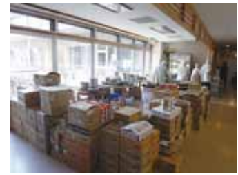
写真12 厨房を失いライフラインが停止した施設ではカセットコンロで調理