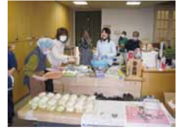
写真16 施設が地域の独居高齢者に配食の支援

で担いで移送。津波防災への意識が高く、日頃からの避難訓練が奏功。1階が浸水するも奇跡的に全員助かる。しかし、周辺地域の浸水により施設は孤立。3日後に自衛隊からの物資等支援が到着するまで、備蓄等で乗り切る。その後の暮らしと介護の継続を支えたのは、屋上に設置していた本格的な自家発電装置。重油の残量から電気の利用時間と方法を決定。痰吸引、酸素など介護上必要となる容量を考慮しながら計画的に使用。断水の2週間は受水槽の水を運搬。トイレは5回に1回流水、食器はラップをかけて使用するなどして節水。ガスは2カ月以上たっても未復旧。厨房も被害を受けたため、2階廊下に仮厨房を設置。ボランティアの力も借りながらカセットコンロで200名分の食事を提供し続けて命をつなぐ。