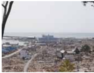
写真3 津波被害を受けた石巻市立病院 [写真3・7・8、撮影:敵爽]