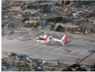
写真6 患者を救助するドクターヘリ