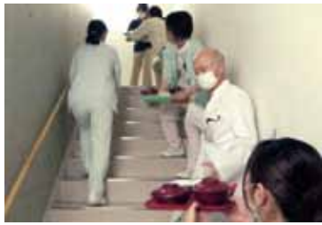
写真2 人海りレーによる配食