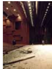
写真34 多賀城市 文化センター