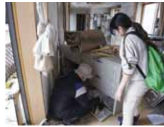
写真11 大切なモノ、思い出のモノを探しに来た被災施設の職員