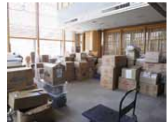
写真18 施設に届けられた各方面からの支援物資 [写真9-12・14・15・18撮影:石井敏]

人的・物的な被害の程度や状況の差はあるが、今回の震災では高齢者施設を含む多数の福祉施設が被災。被災地・被災施設で対応が困難になった多数の要介護者が避難所や他の施設に避難して生活してきたし、現在もその状況は継続している。人の命と暮らしを守ることが使命の福祉施設がこれほどまで大きな被害を受けた現実はきわめて重い。