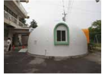
写真8 他県から寄付されたドーム型診察室(待合と眼科診察室として利用されている)

医療行為を行う「病院」という拠点を失った医療スタッフは3月17日から、3チーム体制で避難所の医療サポート、他病院の応援、離島の医療サポートに取り組んだ。避難所への医療サポートが最終的に「福祉避難所」開設につながり、現在でも要介護・要医療の被災者を支える拠点になっている。4月7日から、旧教育委員会の建物を利用した新たな医療拠点として、従来の半分の7診療科による仮診療所で医療を再開した。