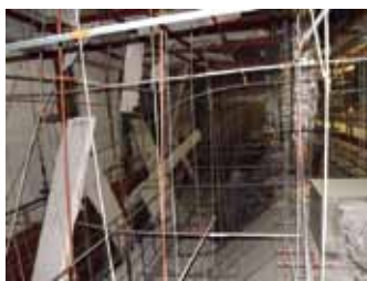
写真35 多賀城市文化センター天井裏