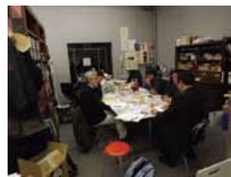
写真38 ARCT (せんだい演劇工房10-BOX)

第二に、津波で被災した施設と九段会館をのぞけば、利用者やスタッフの人的被害（軽傷を除く）は確認されていない。地震発生が金曜日の午後という比較の利用状況が少なかったことはもちろんであるが、避難誘導が各施設の現場スタッフにより迅速かつ適切に行われたことは非常に大きい。他方、スタッフが非常用音響設備に辿りつく前に全員がホワイエに避難した例もあるように、災害時におけるスタッフのアクティビティと施設の関係性を軸に、非常設備を含めた計画対応も視野に入れるべきである。