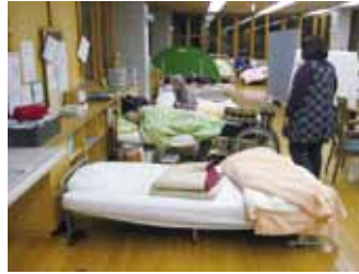
写真14 介護ボランティアによって運営された施設内「福祉避難所」