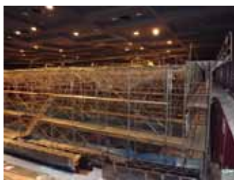
写真37 川内萩ホール