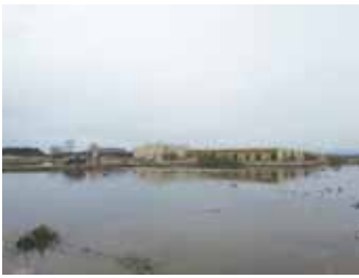
写真9 津波により多数の犠牲者が出た高齢者施設