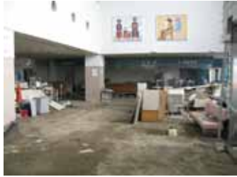
写真5 津波被害を受けた石巻市立病院外来