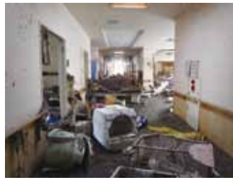
写真10 津波の威力と犠牲の大きさを物語る施設内部