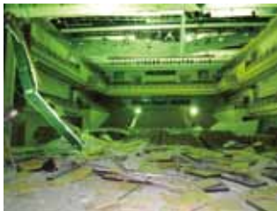
写真32 太白区文化センター