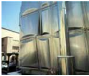
写真1 破損した高架水槽