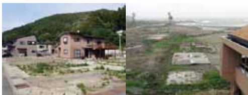
写真28・29 周辺住宅地の被災状況も異なる。左は住宅・住民が残る岩泉町小本小学校周辺。右は学校を残して構造物が流出した山元町中浜小周辺

現段階では、同居する学校がそれぞれ組織として独立して運営されているが、長期化すれば一体運営をする例も出てくるだろう。学校の再配置がこれから本格的に検討されれば統廃合も選択肢となる。とはいえ、児童生徒の減少に伴う一般的な場合と違い、学校の存続の判断が地域の存続と結びつく。学校が地域の核であることが今までになく重要になっていると言える。