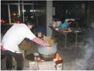
写真13 かまどを使っての夕食の準備