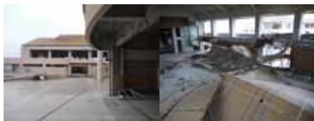
写真19 津波の直撃を受けた校舎。躯体は残るが、内部は破壊されている【山元町 中浜小】 写真20 床がめくれた体育館【山元町 中浜小】

学校施設に関して、立地、耐震性能、防災・避難所機能、避難のあり方など、いくつもの課題が顕在化しているが、本稿では、校舎や周辺地域が大きな被害を受けた小中学校の再開運営の実情について、6月下旬から7月下旬にかけて行ったヒアリング(表1参照)をもとに報告する。