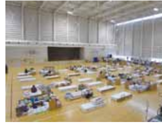
写真15 医師・看護師が常駐する要介護者専用の文化ホール内「福祉避難所」