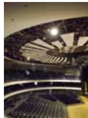
写真33 仙台サン プラザ