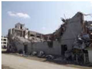
写真30 陸前高田市民会館 [写真30-38 撮影:坂口大洋]